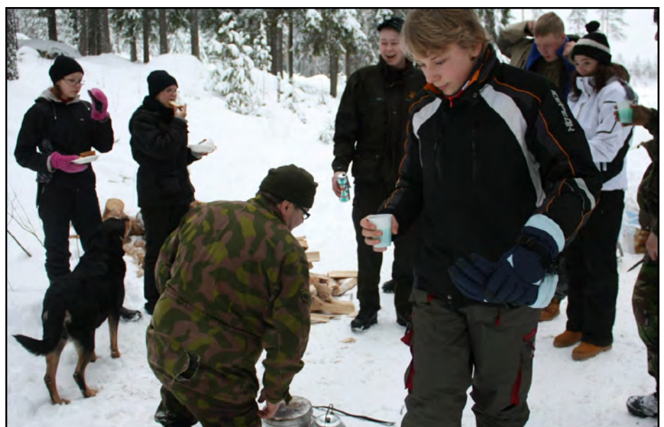
Veden keittoa trangialla