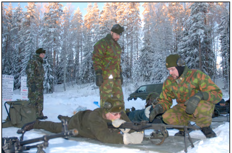
Ampumapäivä sivulla 13