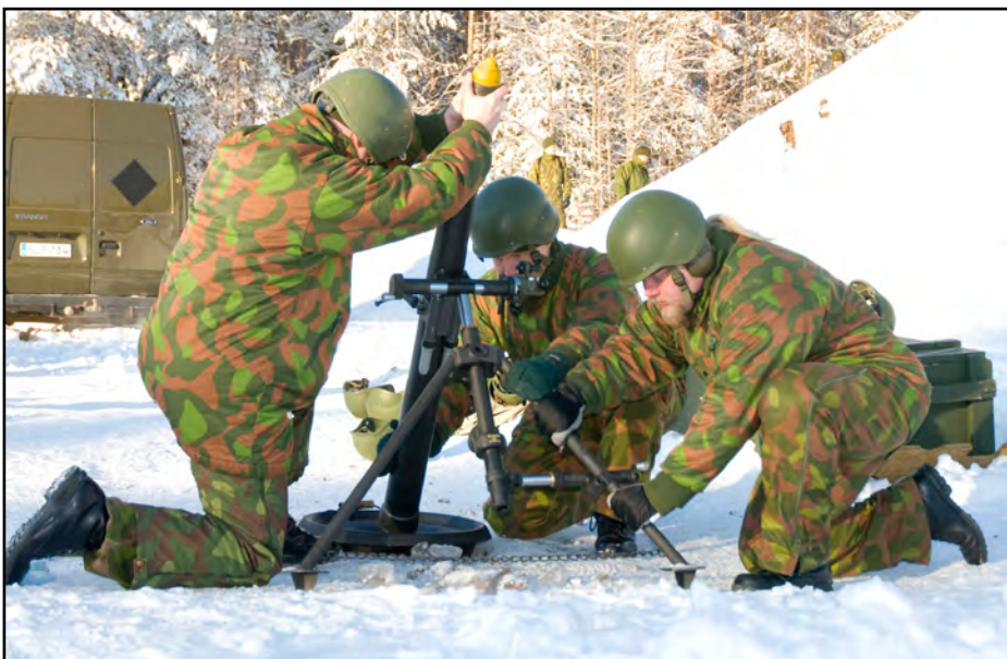
Keveyen kranaatinheitimen käsittelyharjoitus

Kova pakkanen aiheutti hieman ongelmia kaluston kanssa, mutta reserviläiset eivät lannistuneet sään kourissa. Osa reserviläisistä oli osannut varautua kylmään talvipäivään ottamalla mukaan termospullon lämmintä juomista, jota oli mukava hörppiä nuotion ääressä odotellessa omaa ampuvavuoroaan.