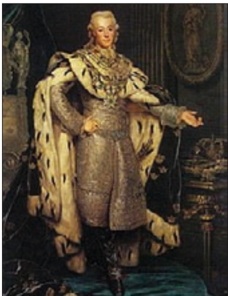
Ruotsin kuningas Kustaa III.

Eteneminen keskeytti upseerien tekemä kapina, ns. Anjalan liitto, vehkeily Venäjän keisarinnaa kanssa kunin-