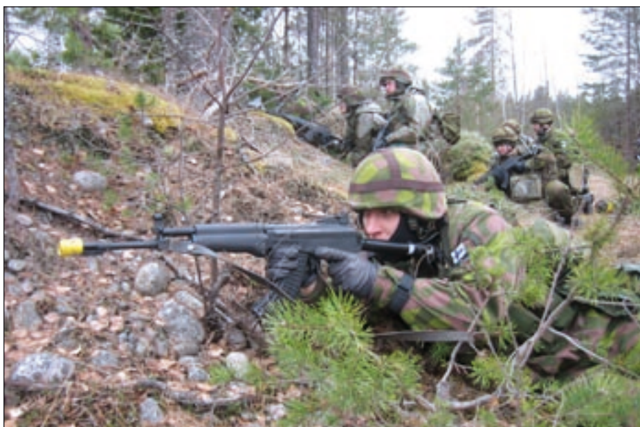
Myrsky 2010 s.14..