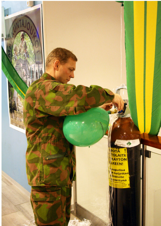
Ilmapallot tekivät kauppansa Triossa s 8