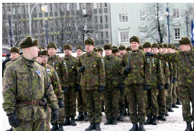
Itsenäisyypäivän paraati 6.12. kuuluu komppanian loppuvuoden tapahtumiin.