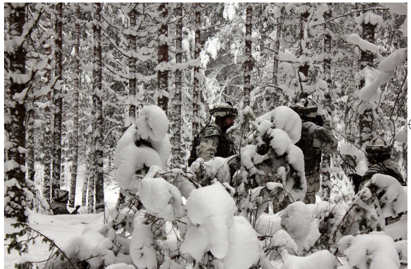
Tehtävä -etsi kuvasta taistelijat. Luminen metsä on paitsi kaunis, myös haastava ympäristö taisteluharjoitukselle.