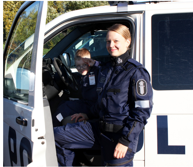
Koulun perhepäivässä syksyllä me kokelaat saimme esitellä poliisioiskelua omille perheillemme.