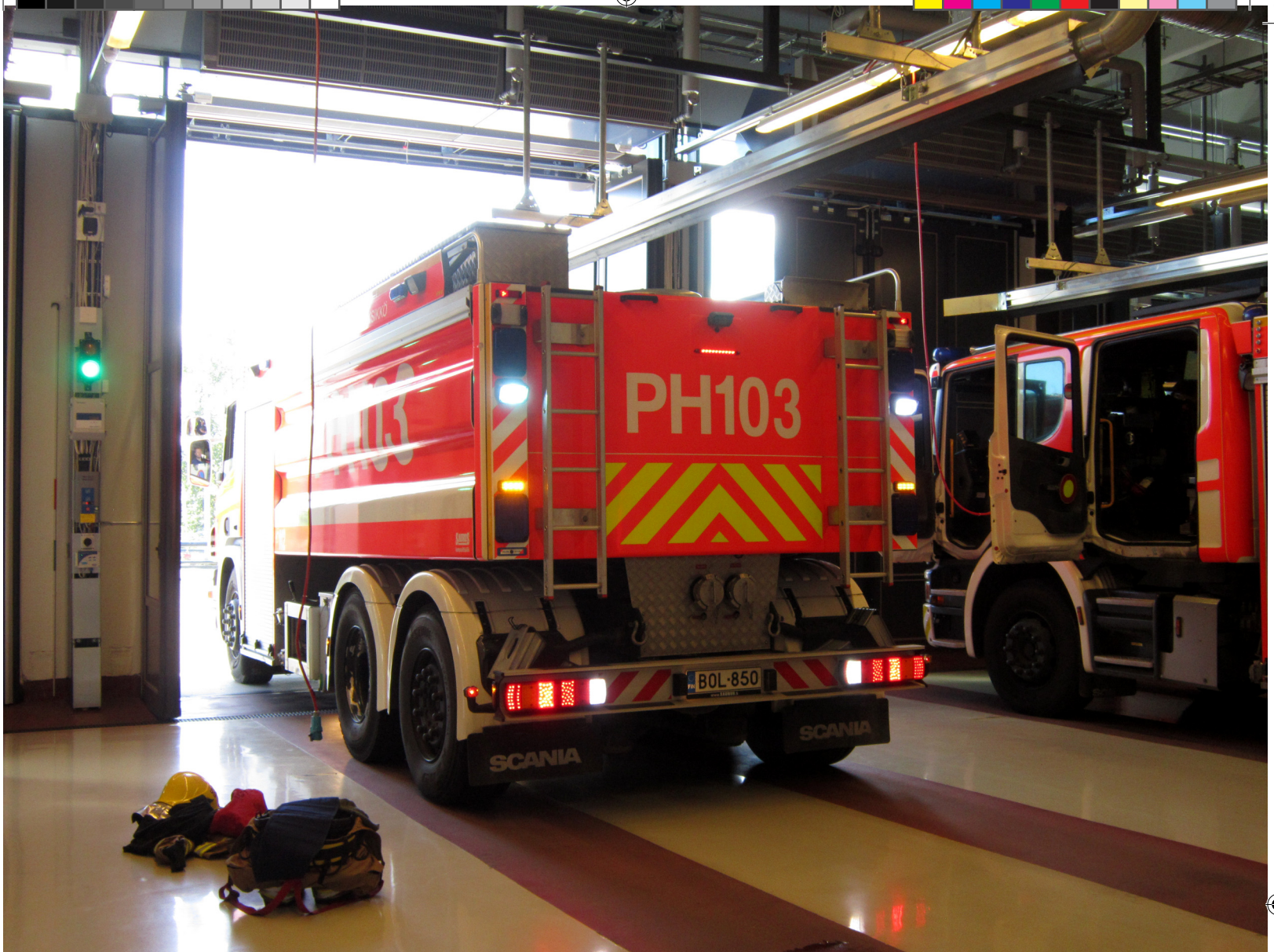
Hälytysajon jälkeen kalusto peruutetaan paikalleen odottamaan seuraavaa tehtävää.

kerran-pari vuodessa pelastuslaitoksen kanssa, mutta poliisi käyttää sitä useamminkin.