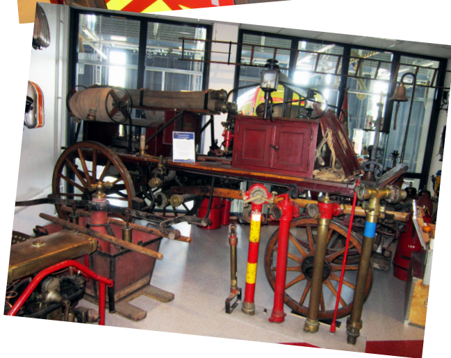
Uuden kaluston rinnalla esillä myös historiaa, hevosvetoista moottoriruiskua ei enää katukuvassa näe. Yläkuvasta näkee, kuinka paljon kalustoa kulkee myös pelastusyksikön katolla.

totilojen (ruokailutila, kuntosali jne.) ohi ja saavumme autohalliin. Osa kalustosta on tehtävällä, mutta paikalla olevissa ajoneuvoissakin on tarpeeksi katseltavaa ja kuvattavaa. Toinen pääty autohallista on varattu ensihoidon kalustolle. Pelastuslaitoksen kaluston puoleisella päätyseinällä on Möysän asemalta siirretty upea taideteos palomiestyökentelystä.