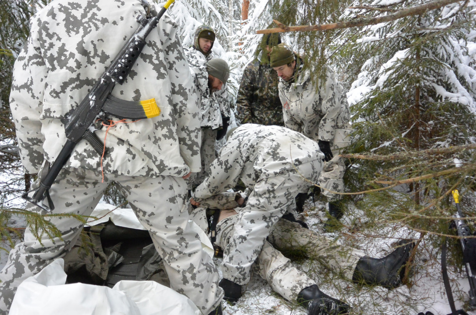
Kylmä asettaa myös taisteluensivulle omat erityisvaatimuksensa.