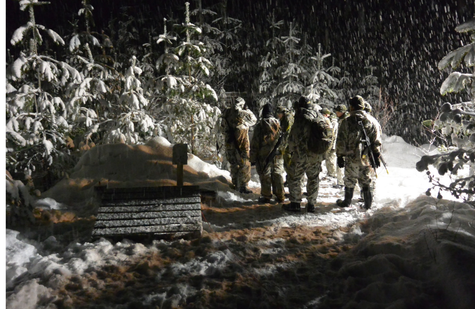
Yllä: Käskynjako ampumaradalla. Viereisellä sivulla: Ruoan valmistusta kenttäolosuhteissa. Alla: Pimeäämunta TA-kiväärillä.