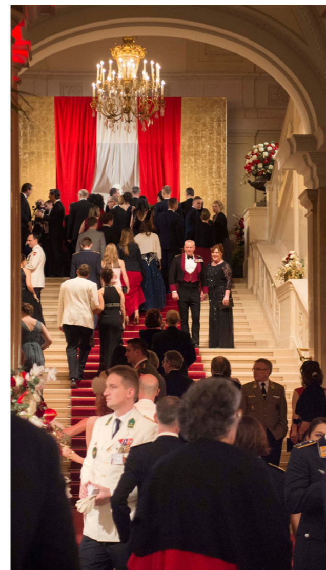
Itävallassa juhlittiin näyttävästi.