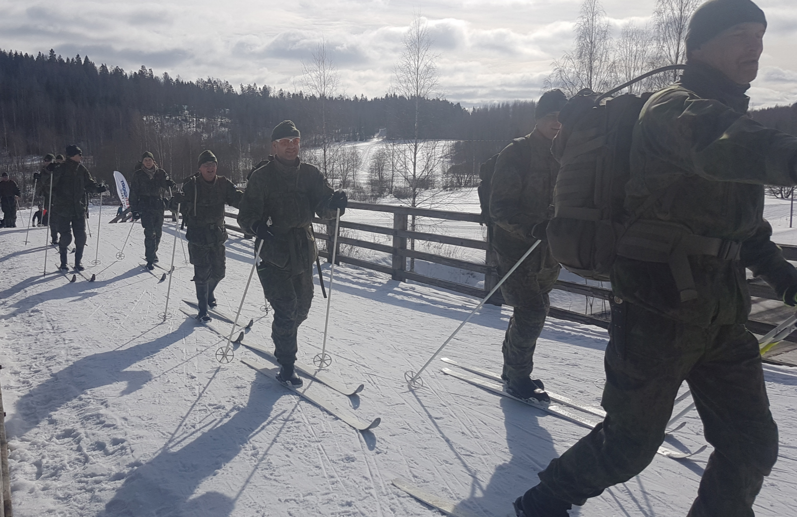
Maaliskuussa marsittiin hiihtämällä Hälvälästä Lahteen ja takaisin.