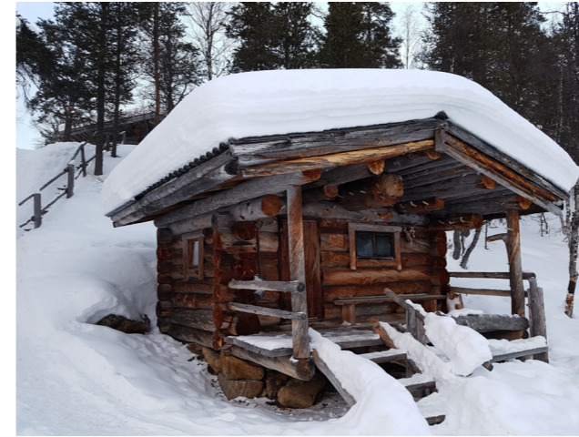
Kuvat yllä ja alla: Majoitustilat olivat hyviä, vaikkakin hetkittäin hieman ahtaita. Viimeisenä yönä 6 hengen tuvassa samalla laverilla nukkui 12 ihmistä.