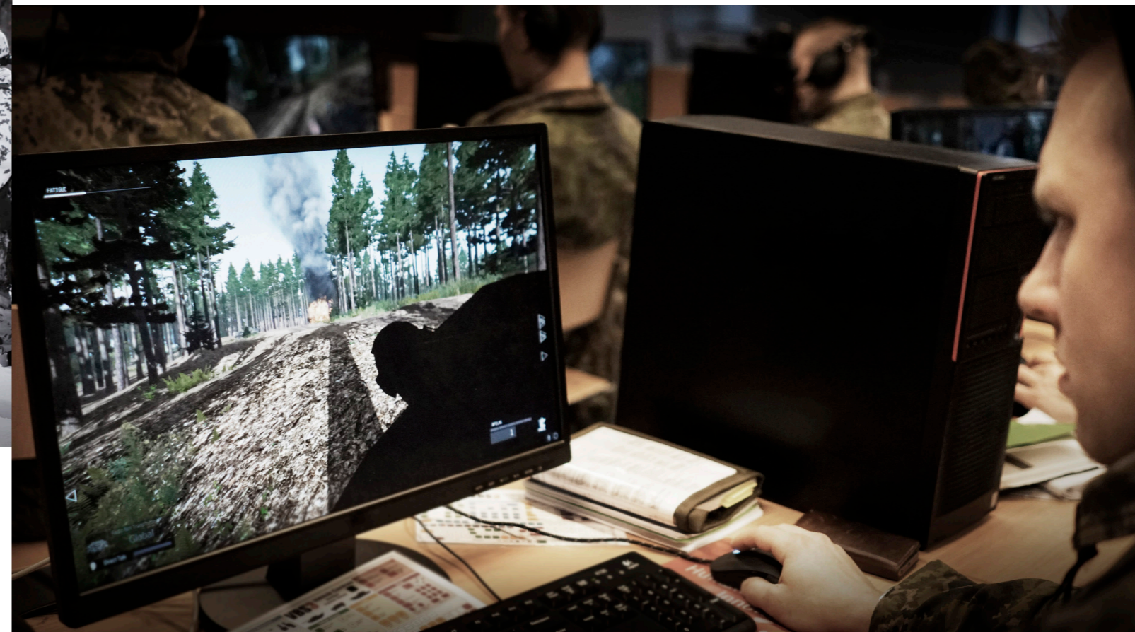
Virtual Battlespace -tietokoneohjelman käyttöä

ryhminä katsoneet paikkamme valmiiksi ja harjoitelleet irtautumisreitit, nousimme kuorma-autoihin ja meidät ajettiin toisen joukkueen tuliylläkköön.