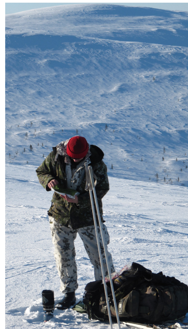
Lounas näköalalla. Tunturissa kokkailu rajoittui veden keittämiseen.