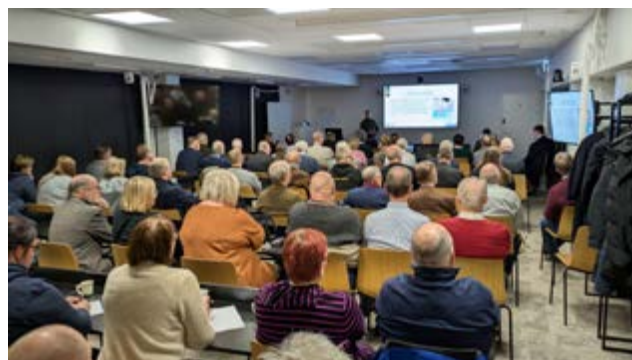
Päijät-Hämeen maanpuolustusilta.