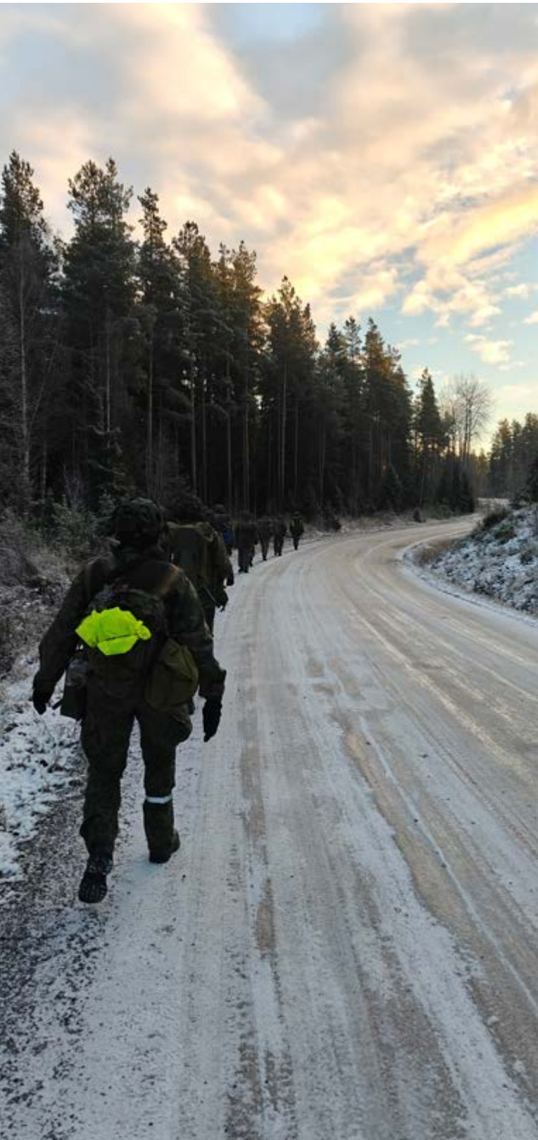
Välillä oli tunnelmallistakin.