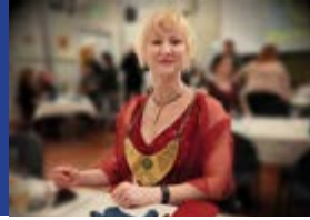
Päijät-Hämeen maakunta- komppanian vuosijuhla.

Melkein pääsin kirjoittamaan tähän lehteen kolmenkymmenen kilometrin hiihtomarssista, johon minun oli tarkoitus osallistua talvilomani alkajaisiksi helmikuun loppupuolella. Ikäväkseni flunssa yllätti muuttamalla kaikki suunnitelmat, ja lehtihommia (viimeisten juttujen metsästys, oikoluku, taiton suunnittelu) tuli tehtyä teemuki yhdessä ja kaakaomuki toisessa kädessä. Katsotaan, onko vielä hiihtokelejä maaliskuun puolivälissä, kun toinen hiihtomarssi on ajankohtainen.