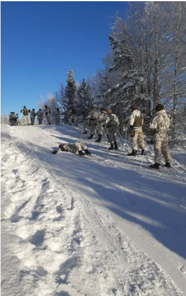
Sysmän talvikurssilla harjoiteltiin talvisia taitoja.

PÄIJÄT-HÄMEEN MAAKUNTAKOMPPANIA www.maakuntakomppania.fi www.facebook.com/phmaakk www.instagram.com/phmaakk @phmaakk #phmaakk