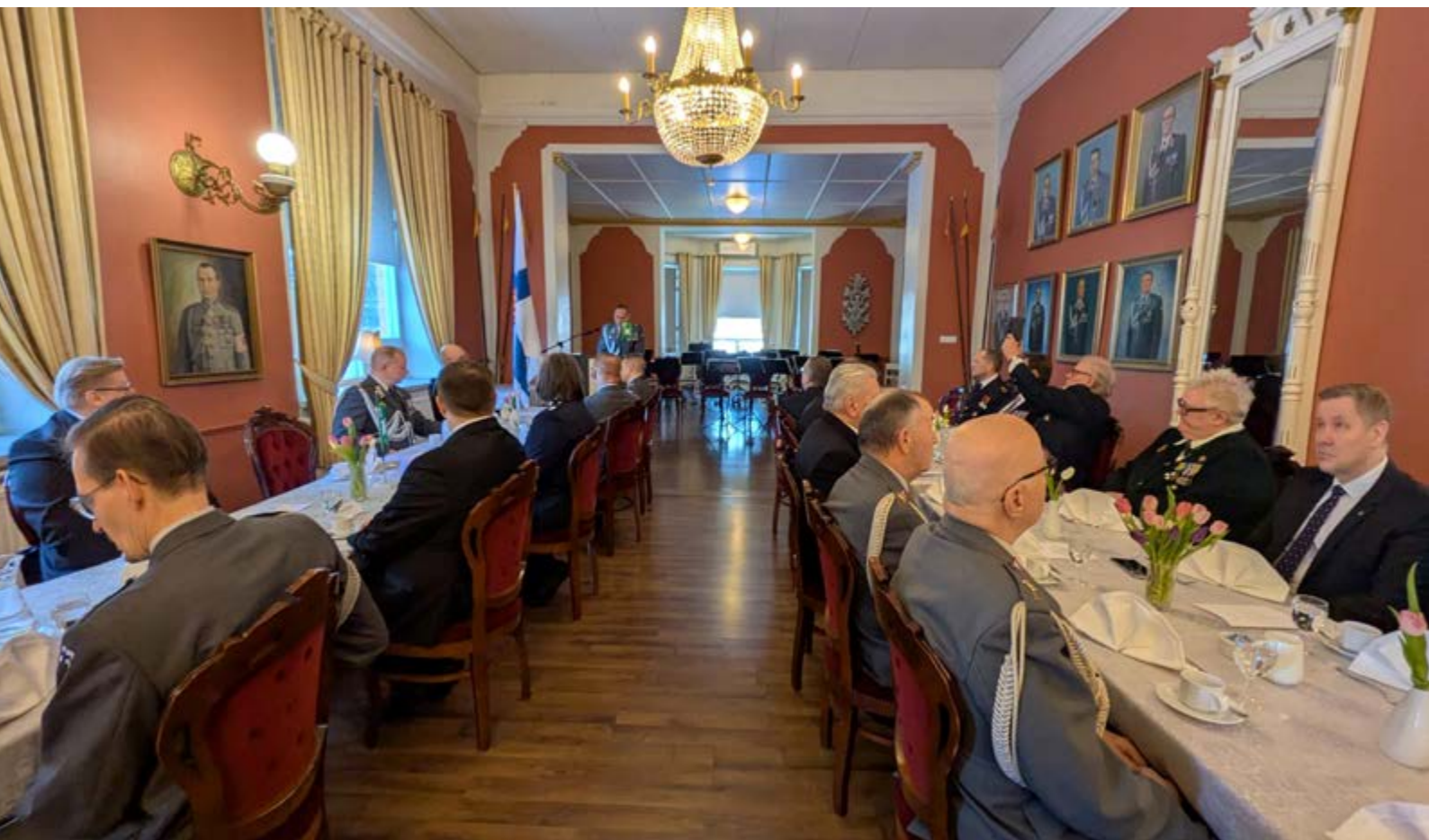
Hämeen aluetoimiston vuosipäivää juhlittiin helmikuussa Lahden upseerikerholla.