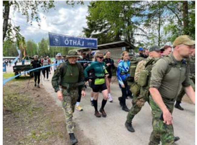
Kesäyön marssiin osallistui viime vuonna noin 270 kulkijaa.

Vuoden 2026 marssi kulkee pääosin samoja polkuja ja väyliä kuin viime vuonna.