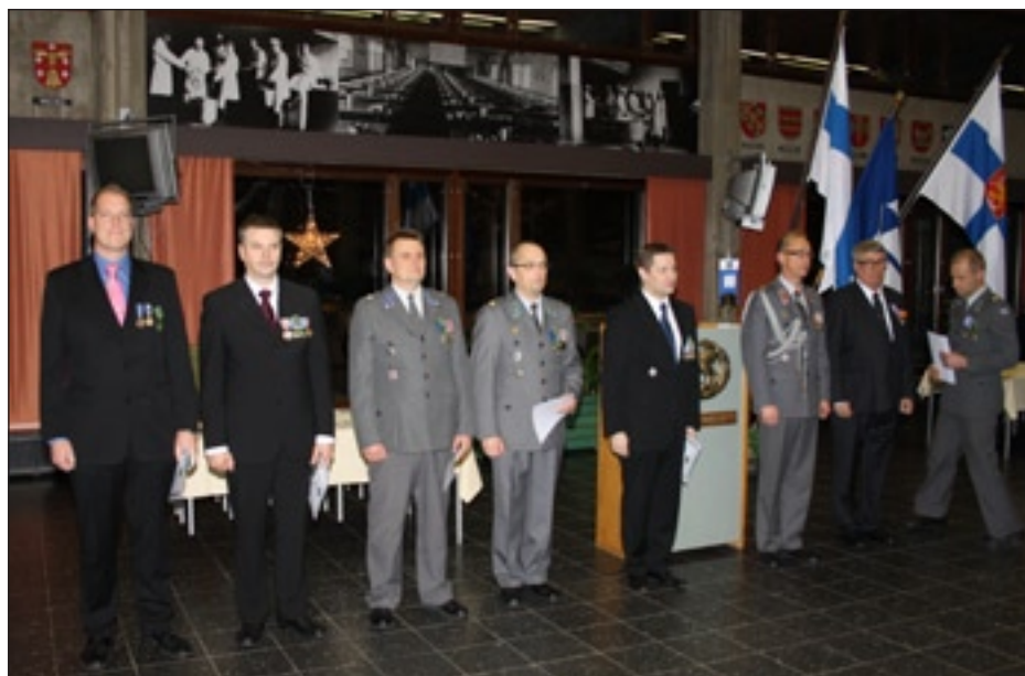
Vuosijuhla päättyi maanpuolustuspiirin vuoden s.9