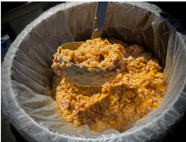
Ratsumestarin erikoinen à la Led Zeppelin. Bon appetit!

Muonituskurssi hoiti Huhti-Hälvässä yhdeksän kurssin ja 200 kurssilaisen aamiaiset, lounaat, päivälliset ja iltapalat – tehtäviin kuuluivat valmistus, jakelu sekä jälkihuolto (eli tiskaus) viidentoista kokeneen kurssilaisen voimin. Uutta kurssipäiviin toi muonaporukan siirtyminen Taruksen leirialueelle Padasjoelle, jossa harjoitteli kolme kurssia.