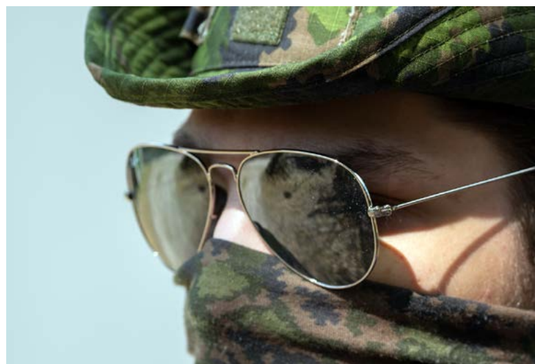
Pelkät aurinkolasit - parempi kuin ei mitään.