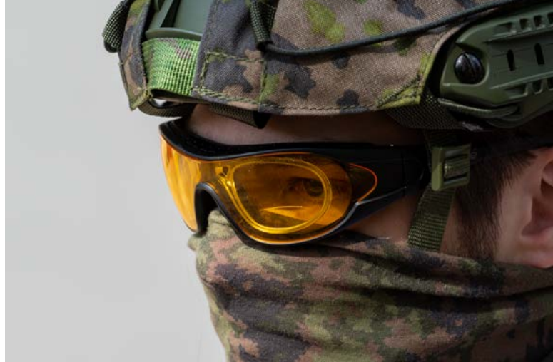
Taktiset suojalasit näönkorjauslinseillä.

Silmiä voidaan myös leikata. Niin sanotussa linssileikkauksessa silmän oma linssi eli mykiö vaihdetaan. Salomaan mukaan tämä lähtökohtaisesti auttaa, mutta joskus hämäränäkö voi leikkauksessa jäädä korjaantumatta. Laserleikkauksella taas korjataan silmän omaa linssiä.