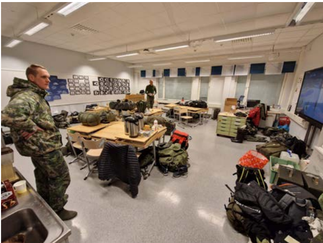
Majoitus Toivalan koululla.

Matka 77. Oltermanniin alkoi Parolan varusvarastolla keskiviikkoamuna. Varusteiden noudon ja ruokailun jälkeen matka kohti Pohjois-Savoa alkoi sen verran myöhässä, että emme aivan ehtineet ilmoittautua kilpailukeskuksessa, jona toimi Toivalan koulu Siilinjärvellä, määrättyyn aikaan mennessä. Päivällinen Rissalassa jäi saamatta, mutta onneksi järjestäjät toimittivat joukkueelle pussiruokaa. Maavoimien esikunnan aloitteesta tänä vuonna tapahtumaan osallistujat istutettiin luokkaan oppitunneille. Tilanekatsauksen lisäksi pidettiin oppitunti liikunnan tärkeydestä. Sinänsä tärkeä oppitunti, mutta oliko kohderyhmä jalkimmäisessä juuri oikea, niin sitä voi kukin miettiä.