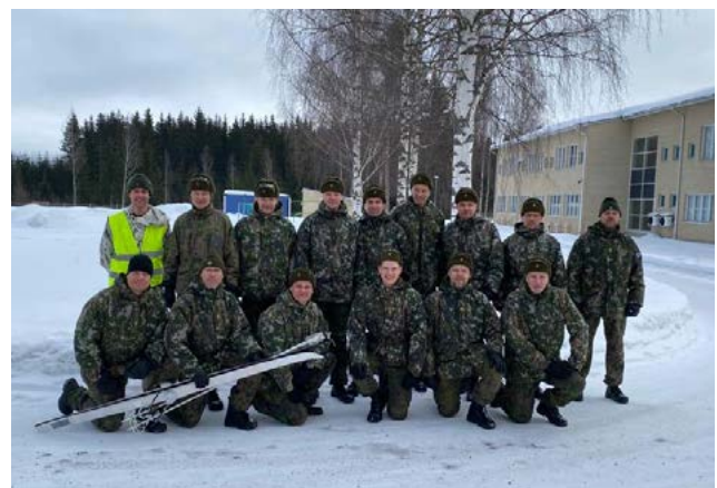
Päijät-Hämeen reserviläisten joukkue vuosimallia 2023.