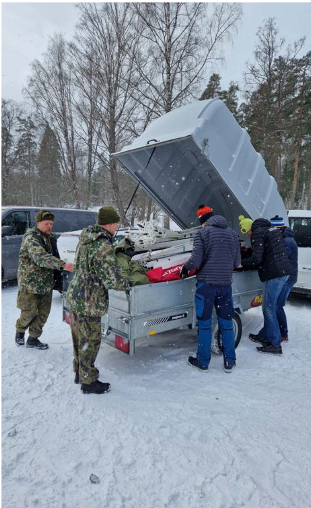
Tavaroiden pakkaamista Parolassa Oltermannin viestihiihtoa varten.

PÄIJÄT-HÄMEEN MAAKUNTAKOMPPANIA www.maakuntakomppania.fi www.facebook.com/phmaakk www.instagram.com/phmaakk @phmaakk #phmaakk