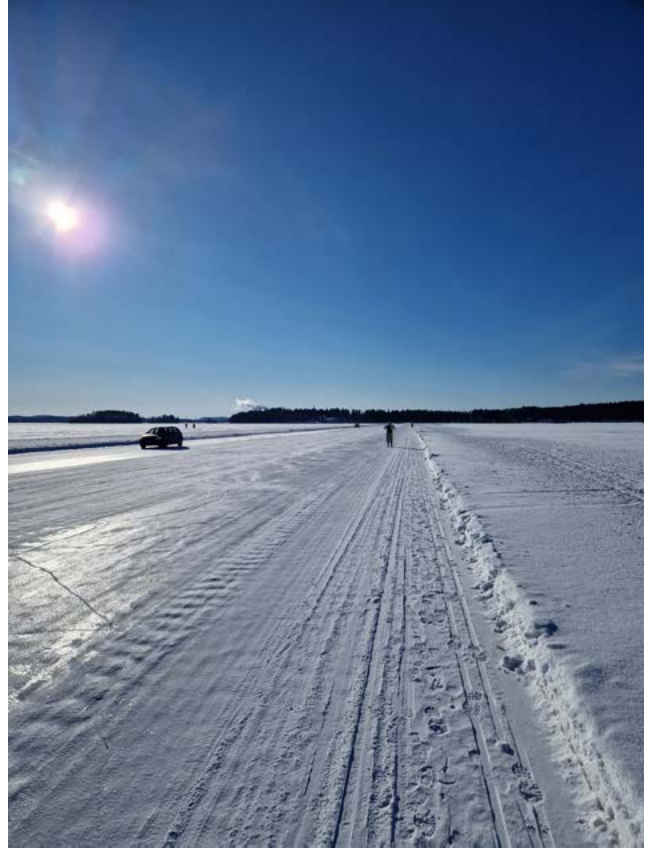
Torstapäivän tiedustelua Kallavedellä.

Joukkueen vahvuudesta suurimman osan ollessa huoltamassa suksia ja muita välineitä joukkueen johtaja, varajohtaja sekä yksi jäsen osallistuivat puhutteluun. Reitti suuntautui Siilinjärven ja Kuopion maisemiin. Järjestäjä oli varannut tukeutumispisteiksi viisi eri kohdetta reitin varrelta. Päijät-Häme tukeutui majoituksen suhteen näihin kohteisiin lukuun ottamatta joukkueen johtajaa, joka majoittautui tuttunsa luona ennen ankkurisuuttaan.