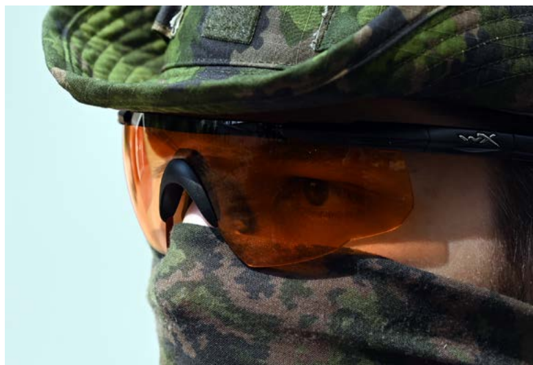
Kunnolliset Wiley x Saber -suojalasit, jotka suojaavat myös sivusta.