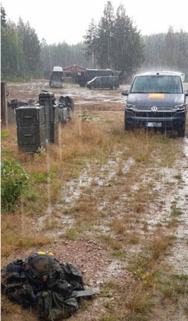
Kauniit kesäkelit hellivät heinäkuun kertausharjoituksessa. Pääasiassa. Pahkajärven osuus päättyi kaatosateeseen.

PÄIJÄT-HÄMEEN MAAKUNTAKOMPPANIA www.maakuntakomppania.fi www.facebook.com/phmaakk www.instagram.com/phmaakk @phmaakk #phmaakk